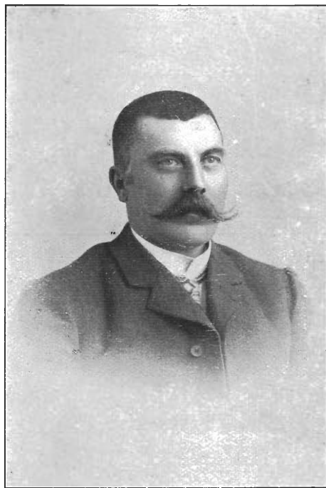
DIREKTION I TIDSRUMMET 1903—1905.

som fast Eiendom, — indbefattet 4 Matr.-nr. i Nygaden og 1 Do. i Nedre Baklandet. Disse Eiendomme, saavel som Ophalingsbeddingen i Iltvigen, der er overtaget som fast Eiendom fra 1ste Mai d. A., har efter Wisløffs Konkurs og til vor Overtagelse tilhørt Privatbanken i Trondhjem. Driften har i disse 2 Aar gaat stadig fremover. I Værkstedet er saaledes indlagt elektrisk Lys og Kraft — og Værkstedet har undergaaet forøvrigt store Forbedringer. For Tiden beskjæftiger Værkstedet paa Baklandet ca. 50 Mand, som fordeles paa følgende Afdelinger: Støberi, Modelværksted, Smedje samt kombineret Maskin- og Drejerværksted. Skibsværftet i Ilen, som ligeledes er forsynet med elektrisk Kraft for Maskiner og Ophaling af Fartøier, beskjæftiger for Tiden ogsaa 50 Mand. Skibsværftet har 2 Ophalingsbeddinger for Skibe indtil 150 Tons. Der udføres for tiden 2 store Dampskibsreparationer. Firmaet er meget bekendt for sine Kirkeklokker, som er en Specialitet. Saaledes er i den sidste Tid leveret 2 store Kirkeklokker til Lademoens Kirke, vægtig ca. 1200 kgr. tilsammen, og er nu tillige overdraget Leverancen af lignende Klokker til Aalesunds nye Kirke. Forøvrigt leveres alslags Støbegods for Fabrikker, Skibe og Bygninger, udfører almindeligt Jern- og Metalarbejde, Reparation af Damp- og Seilskibe, Bygning af Prammer etc. Selskabets Aktiekapital er nu 6000 Kroner, fuldt indbetalt. Bestyrelsen bestaar af D'Herrer J. G. Faanes og H. O. Waade; den førstnævnte indehar Selskabets Prokura.