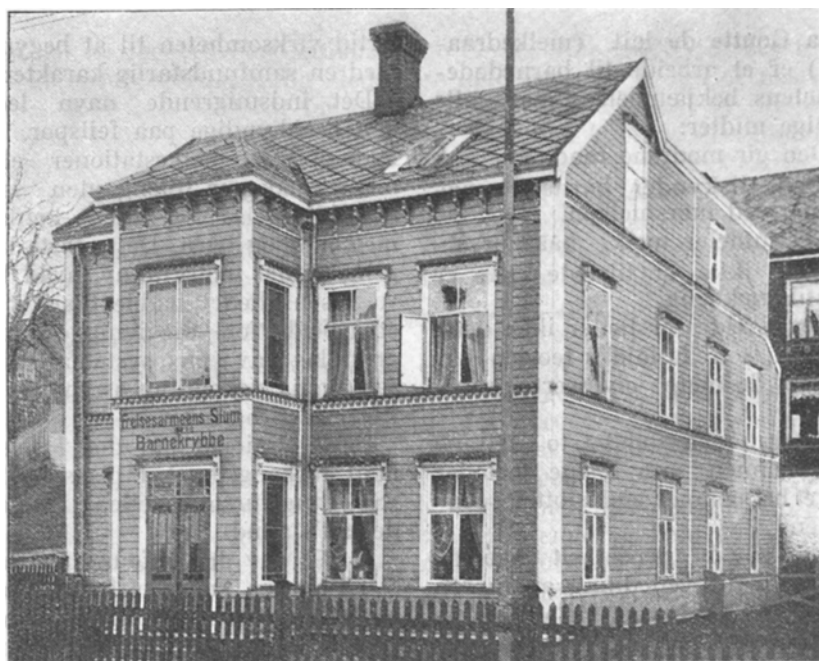
Frelsesarmeens slum og barneherberge, Indherredsveien nr. 1, hvor „Sildraapen“ holder til.