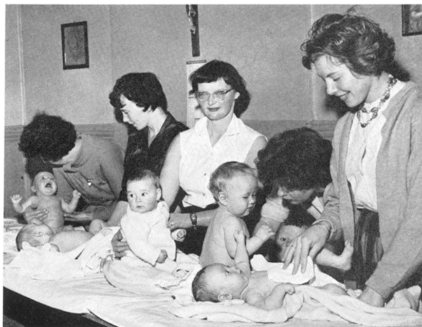
Interior fra kontrollstasjonen.

Bilde og tekst fra 50-årsberetningen 1962