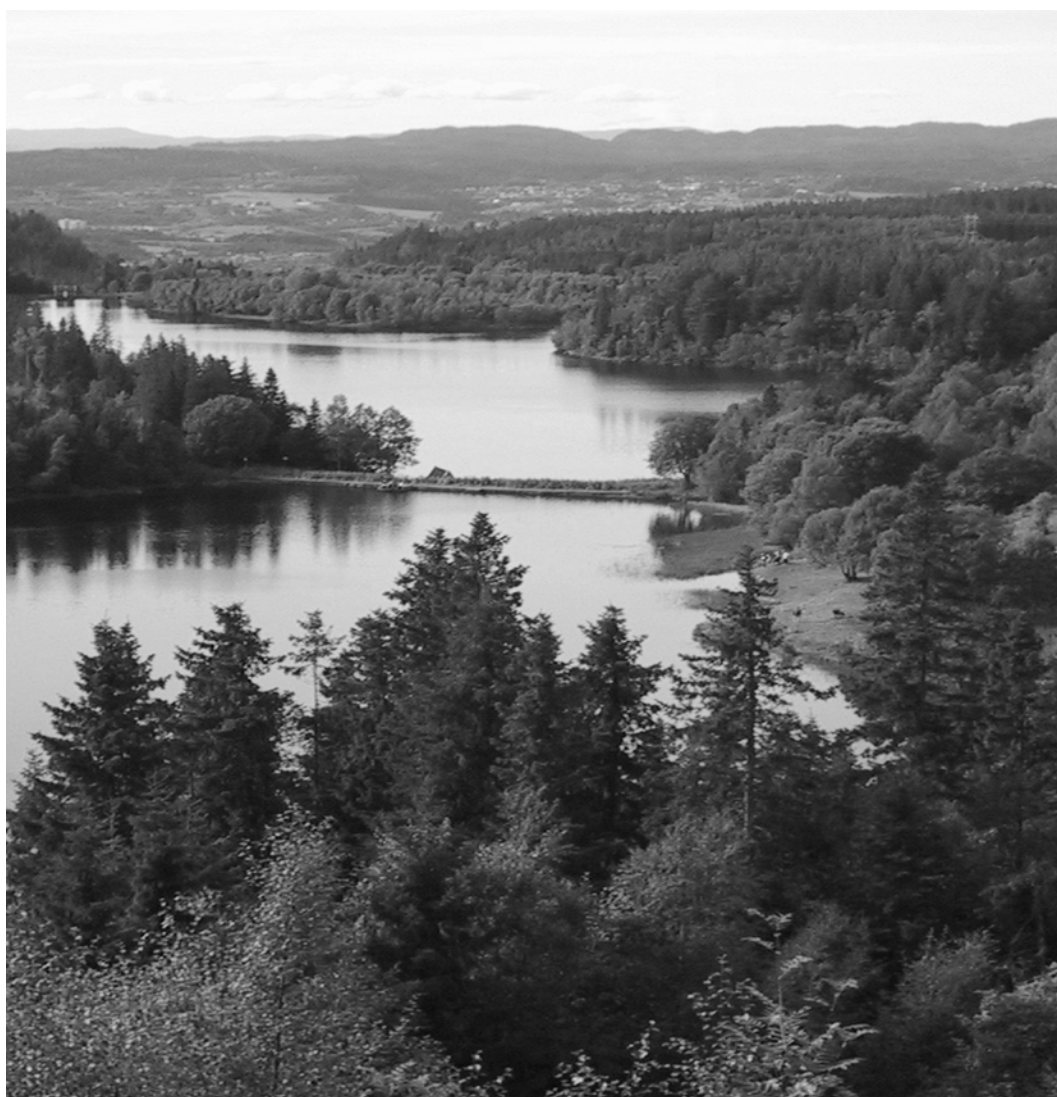
Estenstaddammen og Tømmerholtdammen i september 2001. Estenstaddammen er nærmest. Tuftene etter Estenstad gård vises til høyre i bildet.

Strinda kommune hadde en stor vekst i folketall, noe som også gjenspeiles i ledningslengder. I løpet av 1912 var det