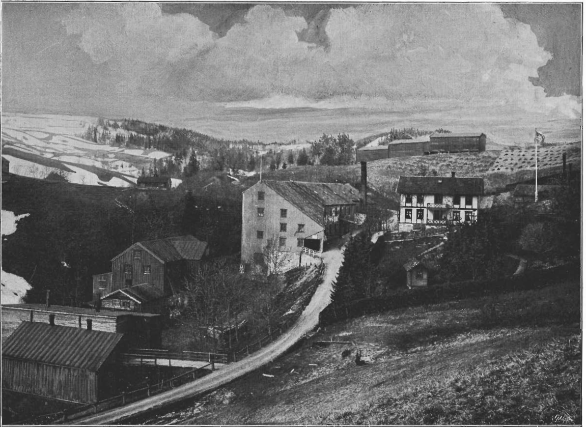
FABRIKBYGNINGERNE MED OMGIVELSER.