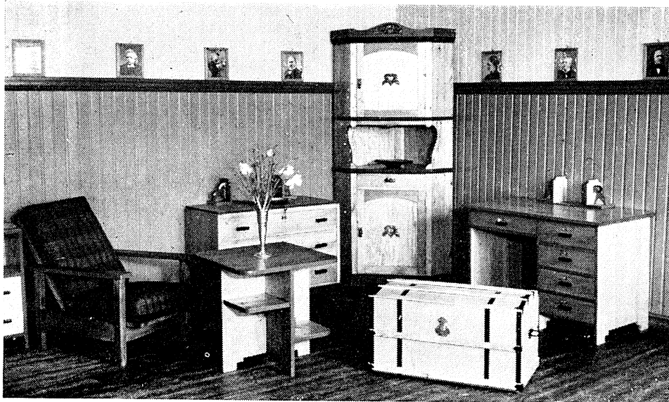
Elevarbeid i sløyd.

Har ein høveleg lærarkrefter, kan gutane få rettleiing i praktisk elektroteknikk.